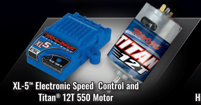
XL-5™ Electronic Speed Control and Titan® 12T 550 Motor