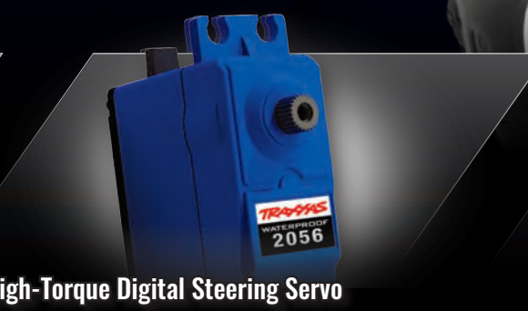
High-Torque Digital Steering Servo