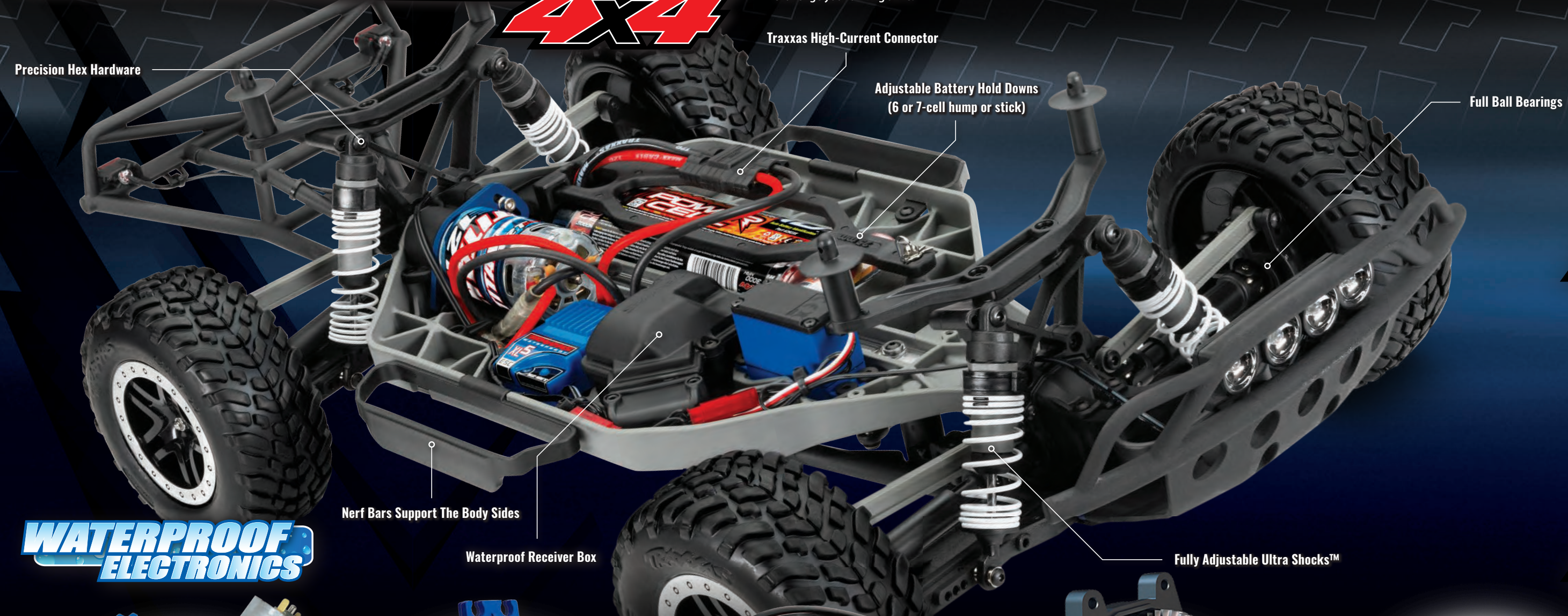
Precision Hex Hardware

The Traxxas Slash 4x4 Short-Course Race Truck puts you in the drivers seat for intense fender-to-fender, high-flying off-road action. The full-scale Short-Course Race Trucks embody the spirit of Traxxas RC with their extreme 900+ horsepower racing engines, full-throttle, dirt-roosting power slides, giant suspension travel, and Supercross-style big air jumps. The Traxxas Slash brings all the action home so you can experience the high-speed head-to-head competition at the track or in your own backyard. The Traxxas Slash hangs it out for an all new way to challenge your driving skills.