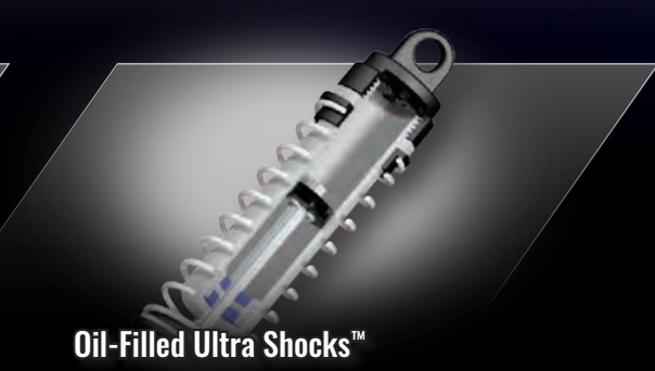
Oil-Filled Ultra Shocks™