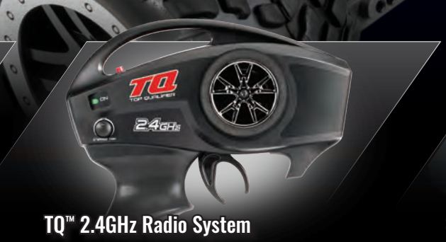
TQ™ 2.4GHz Radio System