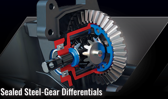
Sealed Steel-Gear Differentials