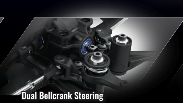
Dual Bellcrank Steering